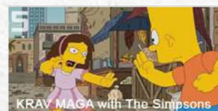
5 Bart dans un épisode des Simpsons