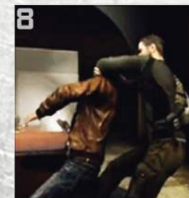
8 Sam Fisher dans le jeu vidéo Splinter Cell Conviction