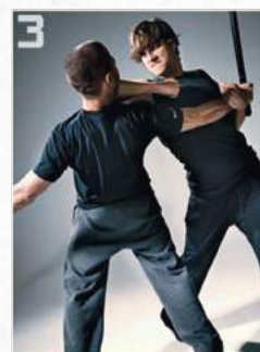
3 Ashton Kutcher dans le film Kiss and Kill