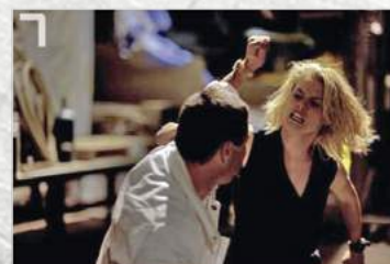
7 Abby Samspon dans la série Drôles de Dames