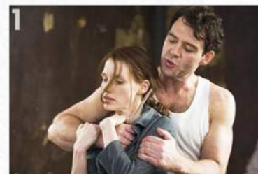
1 Helen MIREN et Jessica CHASTAIN dans The Debt

L e Krav Maga est de plus en plus utilisé dans le monde du cinéma, de la télévision et des jeux vidéos. Voici quelques références, parfois surprenantes, pour découvrir notre discipline favorite en action !