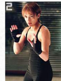
2 Jennifer Lopez dans le film « Enough »