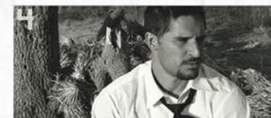
4 Joe Manganiello dans la série True Blood